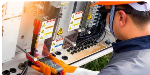
Instalaciones de Sistemas eléctricos AC-DC