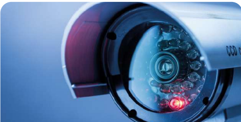
Sistemas de Video vigilancia