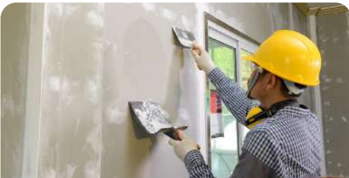
Trabajos en drywall