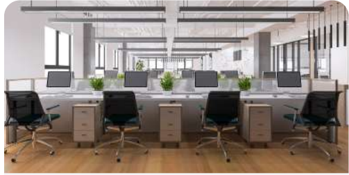
Implementación y remodelación de oficinas