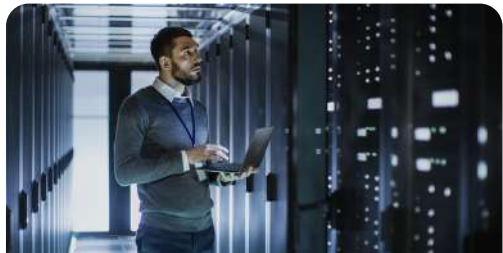
Centro de datos