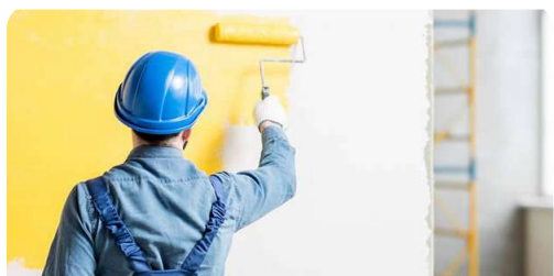
Pintura en general