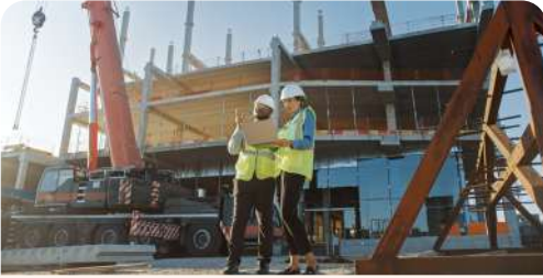
Infraestructura y construcción